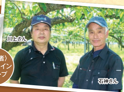
〈生産者〉 ジェニユイングループ

自然に近いかたちで育てることを意識し、 美味しい梨づくりにこだわりを持ったグループです。