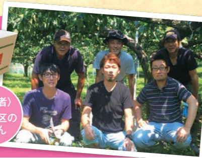
〈生産者〉 矢那地区の皆さん