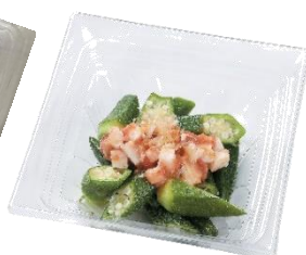
『オクラと長芋 のサラダ』