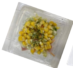
『とうもろこしの コールスローサラダ』

大ぶりのネタを種類豊富にドーンと盛りつけた、自慢の海鮮丼は全4種類を品揃えいたします。ごはん部分はお魚との相性が良い「赤酢」を使用。赤酢は酸味がまろやかで、香り高く、うまみ強いのが特徴です。