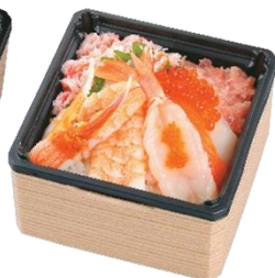
『海の幸！ 贅沢海鮮丼』