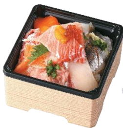
『天然本鮪大トロ入り海鮮重』

ウエハースはホワイトクリームをサンドし、ロイヤルミルクティーの風味でコーティング。お好みで冷やしても美味しくお召し上がりいただけます。