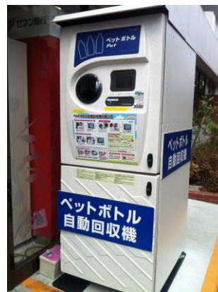
<ペットボトル自動回収機>

(ご参考) 当事業は、本年 2 月に「23 年度環境省支援事業」に選定されました。